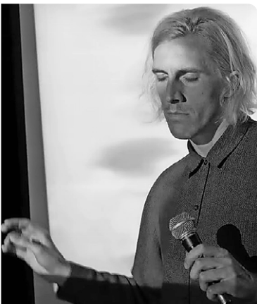
Ruhe vorm Sturm: Cosi e Cosi. Youtube

Bukowski: Cosi e Cosi machen musikalische Experimente, die ziemlich hypnotisch daherkommen. Hip-Hop, R'n'B, Drone fetish, aber poppig. MoreEats, das zweite Konzert an diesem Abend, ist da schon noch mal mehr easy. Sehr