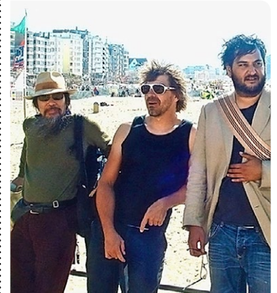
Superterz relaxed.

gleichzeitig mehr als blosse Kunst. Superterz ist ein Quartett, bestehend aus vier Zürchern, die den von ihnen erzeugten Avantgarde-Jazz, Schrägstrich Post-Rock sehr experimentell verstehen. Im Monat